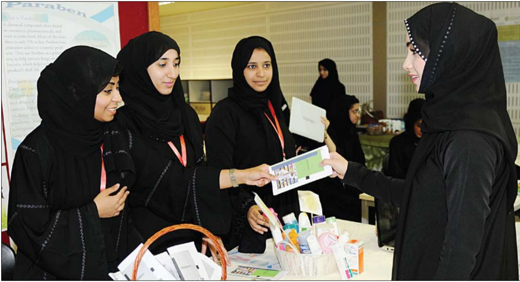
في حملة للتوعية شاركت فيها أكثر من مائة طالبة جامعية